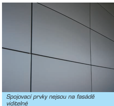
Spojovací prvky nejsou na fasádě viditelné