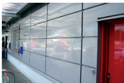
Fasádní kazety KP-FORM+ svým designem dobře vyhovují současným požadavkům architektů na velkoplošné fasádní designy plášťů